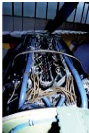
Der 36 Liter Hispano-Suiza -51 12Y, 1000 PS, 2500 RPM