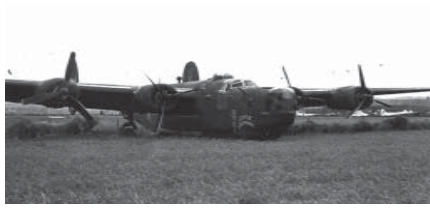
B-24 nach geglückter Notlandung

gezogenem Fahrwerk eine geglückte Notlandung durch. Anschliessend steckte die Besatzung das Flugzeug in Brand.