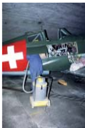
Wenn «Staub'gsuugert» wird, dann muss es wohl bald so weit sein !