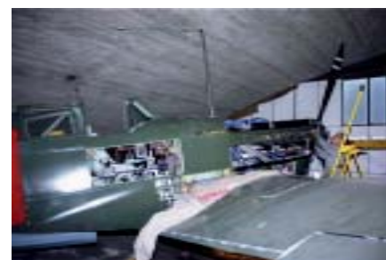
unten: Max montiert die Kühlerlei-