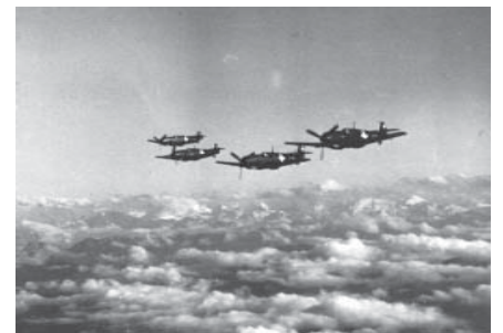
Me 109E, Doppelpatrouille über den Alpen

754 Bomber der 8th Air Force, aufgeteilt in drei Divisionen, hatten den Auftrag, Ziele im Süden Deutschland