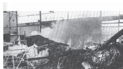
Messerschmitt-Halle, ein rauchender Trümmerhaufen. Links in der Ecke die bruchgelandete Me-262 VI

Zwei Wochen später, am 13. August 1943, erfolgte der erste Angriff bei Tag auf die grossdeutschen Städte Regensburg und Wiener Neustadt, wo sich ein Teil der Messerschmitt-Flugzeugwerke befanden (Me-109, Me-110, Me-262).