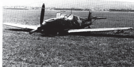
Die Me-109E von Oblt. R.Heiniger nach ge Glückter Notlandung

Im gleichen Schwung kurvten die US-Jäger unter dem Bomber hin-