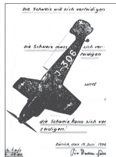
Aufsatz-Titelbild, 2. Sekundarschule in Zürich, 1940

Unsere Arbeitskollegen waren internierte polnische Soldaten, denen es nicht besser erging als uns. Wir arbeiteten zusammen auf dem Feld und wurden dabei gute Freunde. Wir waren dankbar und trotz allen Entbehrungen stolz darauf, dass wir in der für die Schweiz lebensnotwendigen landwirtschaftlichen Anbauschlacht unseren Beitrag leisten konnten. Ich glaube, das darf auch einmal gesagt werden, auch wenn es gewissen Leuten, die diese entbehrungsreichen Zeiten nicht miterlebt haben, gar nicht in den Kram passt.