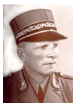
den 31. Dez. 1936 zum Oberstdivisio-

Nach langem Bemühen gelang es im Februar 1938 die Lizenz für den Nach-