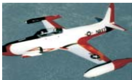
T-33 in den Farben der US Navy