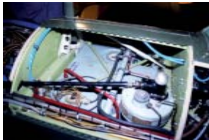
Hydraulikpumpe mit einer Kardanwelle als Antrieb. Zu sehen ist auch der 375 Liter grosse Benzintank.