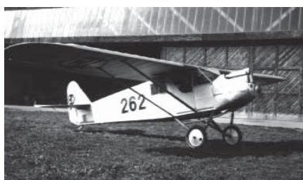
Comte - 262 in Dübendorf ca. 1931. Motor Cirrus Hermes

das erste Kabinensportflugzeug Europas gebaut. Berühmtheit und auch ein darauf folgender Verkaufserfolg wurde dem Flugzeug AC-4 zuteil, als im September 1928 die beiden Sportflieger Oskar Käser und Gottlieb Imhof mit dem Prototypen CH-225 nach Bombay (Indien) flogen. In den Jahren 1929 und 1930 wurden je fünf AC-4 «Gentleman» verkauft.