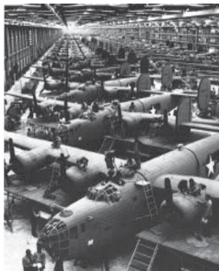
Fließbandmontage in der USA (oben) - parkiert in Dübendorf (unten)

Quellen: «Kleine Fliegereien» von CAF Col. Pio dalla Valle «Stranger in a Strange Land» by Stapfer and Gino Künzli