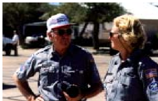
Elisabeth und Henry - was erzählen sie sich wohl?

Telefon: 031 / 390 55 55 Telefax: 031 / 390 55 50 E-mail: post@bern.marti.ch Homepage: www.marti.ch