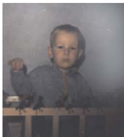
...da war die Welt noch in Ordnung

Trotzdem entwickelte ich schon als kleiner Knirps reges Interesse an den fliegenden Objekten, was schon früh