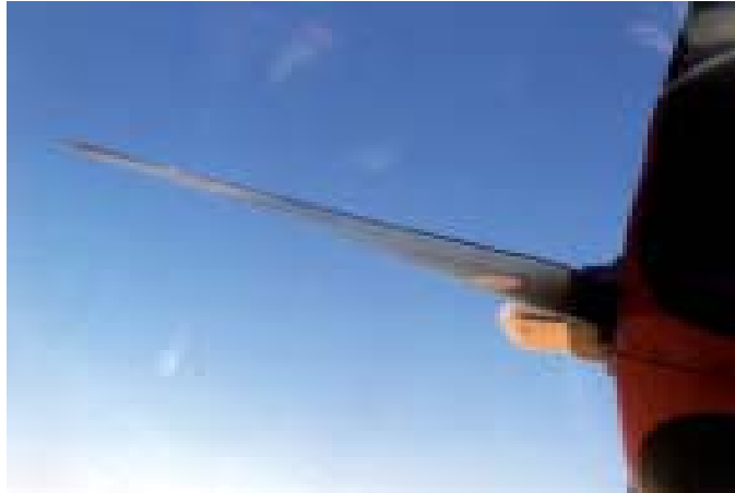
Der 2000 PS starke Stermotor gab den Geist auf.....!

Midland. Zu Beginn der Oelförderung soll dies eine der reichsten Gegenden gewesen sein.