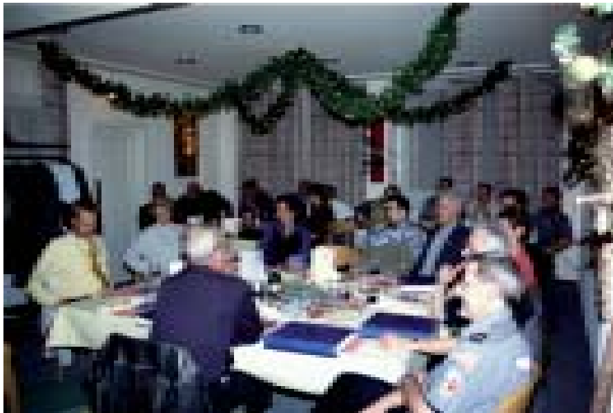
Der Samichlaus erzählt ein G'schichtli - und alle hören andächtig zu ... ..

zwar sogleich zu sinken, aber der Pilot konnte im allerletzten Moment das Wrack verlassen. - Grauenhaft was hätte geschehen können, wenn die ganze Besatzung abgesprungen und der Bomber führerlos in eine Ortschaft abgestürzt wäre!