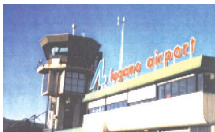
... auch ein sonniger Arbeitsplatz